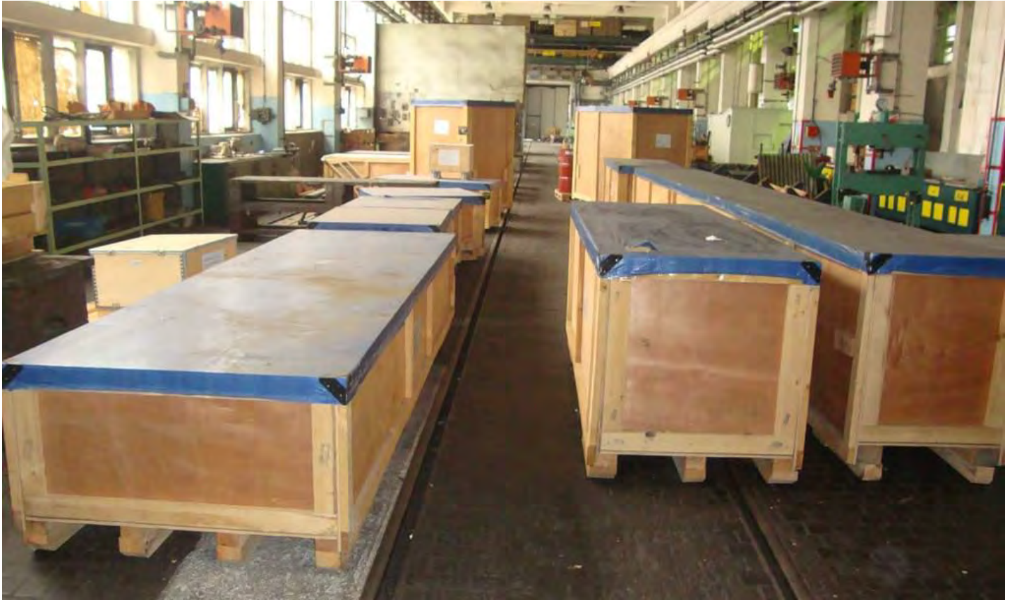
Skladišteni i pakirani postojeći dijelovi brodskog motora za gradnju br. 526