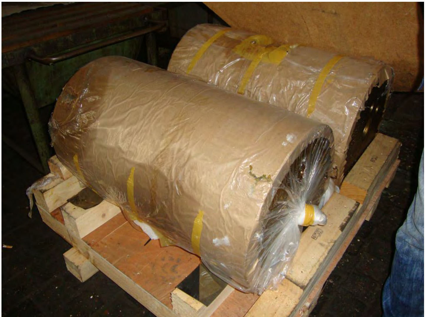
Paletirani postojeći dijelovi brodskog motora za gradnju br. 526