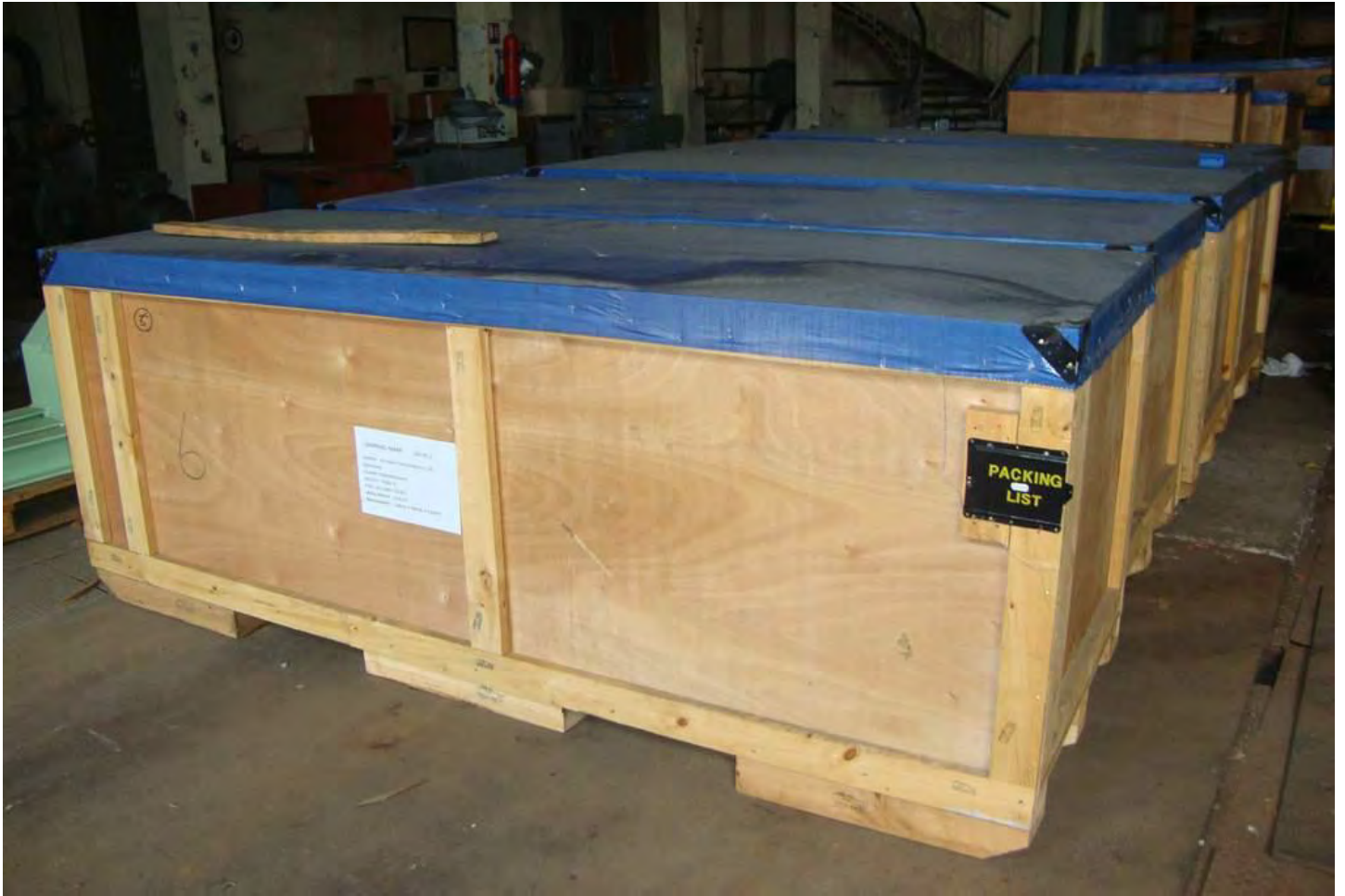
Skladišteni postojeći dijelovi broskog motora za gradnju br. 526