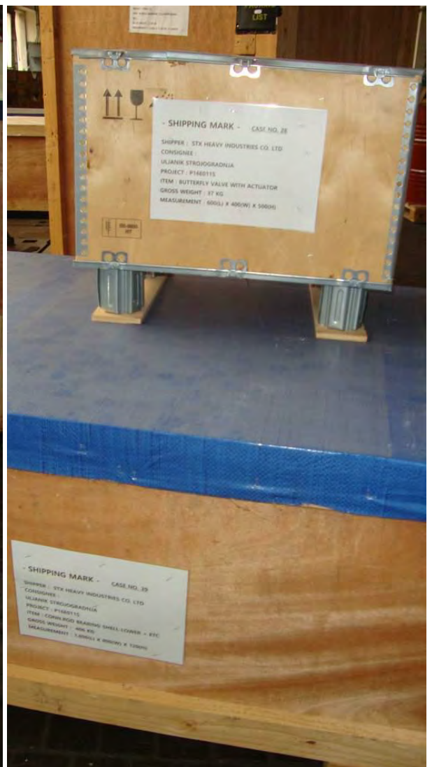
Zapakirani u sanducima postojeći dijelovi broskog motora za gradnju br. 526